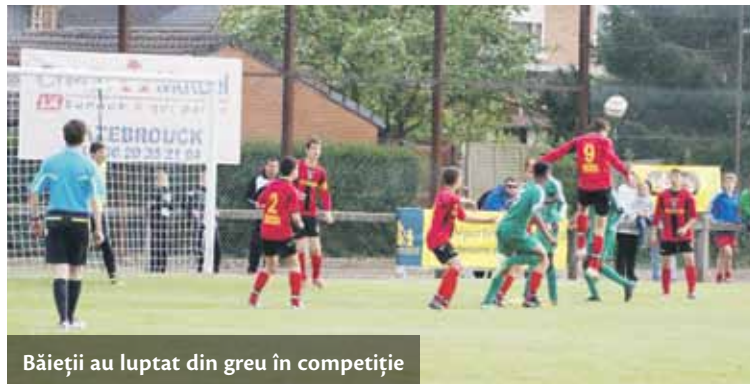
Băieții au luptat din greu în competiție