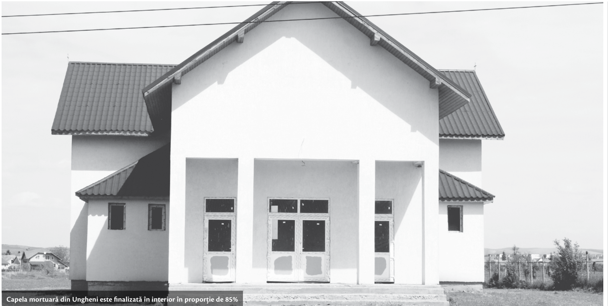
Capela mortuară din Ungheni este finalizată în interior în proporție de 85%

Problema capelei mortuare din orașul Ungheni este una spinoasă și își are începuturile în anul 2009 odată cu includerea acestei investiții în proiectul de buget aprobat de Consiliul Local. Locuitorii din oraș și satele aparținătoare așteaptă finalizarea lucrărilor de ani întregi și asta pentru că în acest moment nu există un spațiu care să poată fi utilizat în acest scop. "Opinia de Ungheni" a obținut toate adresele purtate între Primăria Ungheni și Parohia Ortodoxă I, acte oficiale care conțin date și poziții oficiale reportate la situația capelei. Vă invităm la un exercițiu democratic de informare, transparență și exprimare a părerii dumneavoastră în urma celor prezentate mai jos.