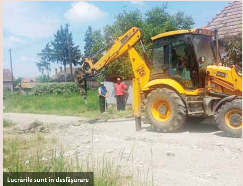
Lucrările sunt în desfășurare

infrastructurii printre cele mai importante lucrări realizate în anul 2013 se numără canalizarea menajeră a orașului Ungheni și a localităților aparținătoare Cerghid, Cerghizel, Vidrasău, Recea și Morești, extinderea rețelei publice de canalizare pentru preluarea, evacuarea și transportul apelor menajere la blocuri și racordurile necesare la sistemul de canalizare, reabilitarea rețelei de alimentare cu apă curentă pe strada Tineretului din Ungheni, renovarea exterioră a dispensarului uman precum și amenajarea terenului din curtea dispensarului pentru parcare autoturismelor, amenajarea a două stații pentru mijloacele de transport în comun în Ungheni – pe strada Mureșului și în Cerghid și amenajarea drumului prin împietruire la Vidrasău (pod plutitor). Edilul orașului promite că administrația publică locală va fi în continuare alături de cetățeni și interesată de problemele mari pe care aceștia le întâmpină.