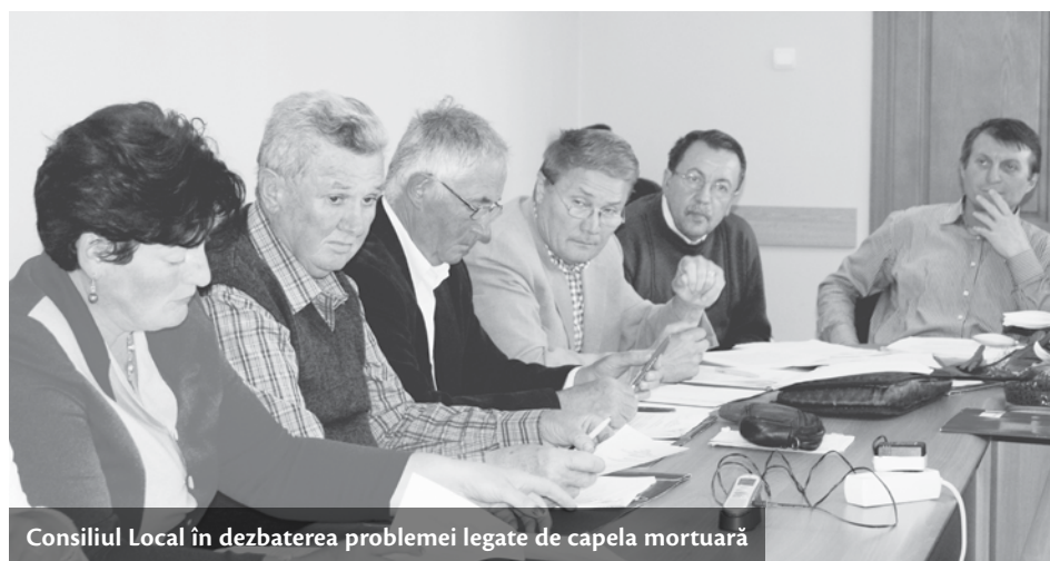
Consiliul Local în dezbateră problemei legate de capela mortuară