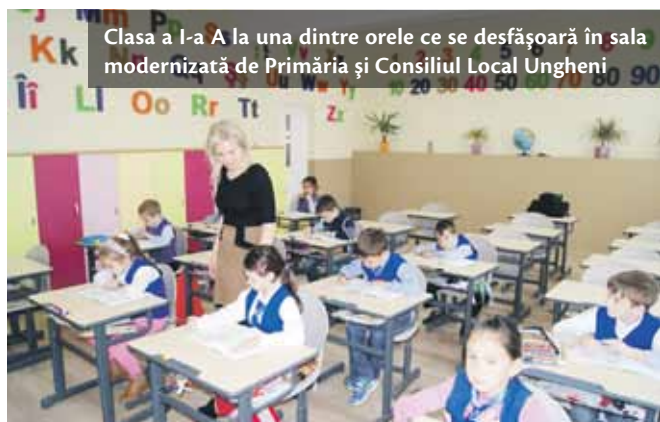
Clasa I-a A la una dintre orele ce se desfășoară în sala modernizată de Primăria și Consiliul Local Ungheni